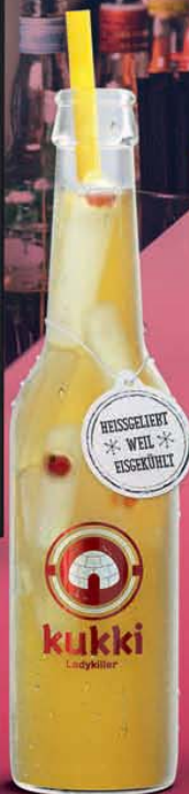
923 KUKKI LADYKILLER