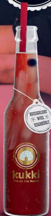
920 KUKKI SEX ON THE BEACH