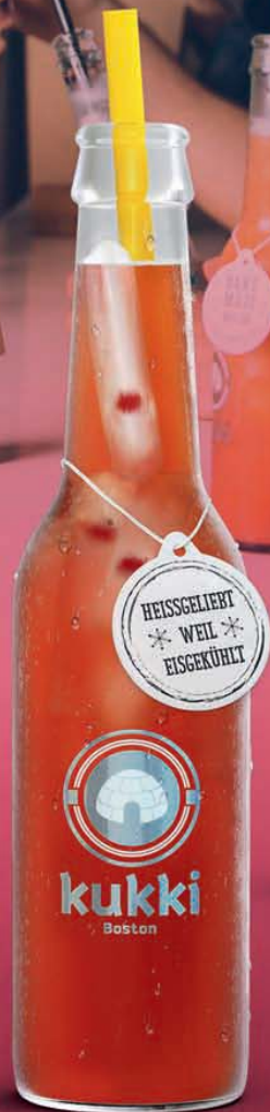
921 KUKKI BOSTON