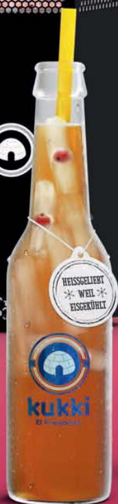
922 KUKKI EL PRESIDENTE