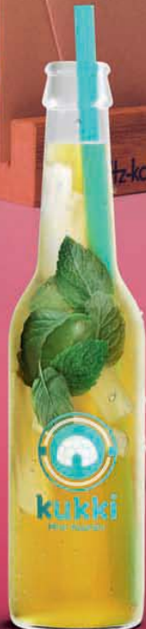
925 KUKKI MINT PASSION