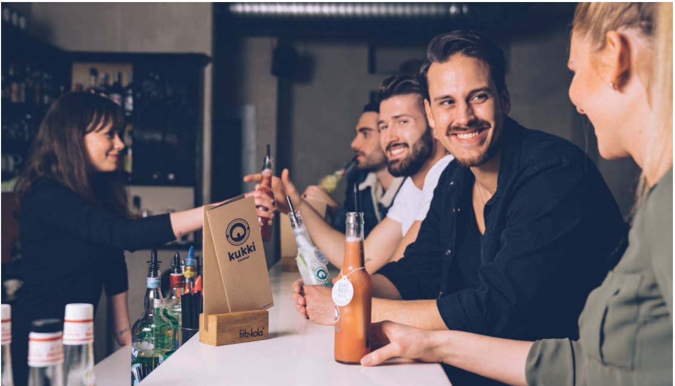
kukki – die tiefgekühlten Cocktails mit höchstem Convenience-Grad revolutionieren das Trink- und Service-Geschehen in Bars, Restaurants, Entertainment- und Event-Lokalen.

Eisgekühlt, fruchtig-frisch, servierfertig. So kommen die tiefgekühlten Flaschen-Cocktails namens kukki nach 30 Sekunden aus einem eigens entwickelten Toaster – Obstgarnitur und Eiswürfel inklusive! Gastgewerbe- und Catering-Größen wie Ritz-Carlton, Aramark oder die Cinemaxx Inhouse-Bars haben das Trendgetränk des jungen Berliner Startup-Unternehmens kukki GmbH entdeckt und ernten damit bereits nach kurzer Zeit einen überwältigenden Erfolg bei ihrem Gästepublikum. In der Schweiz ist kukki jetzt exklusiv bei der Gmür AG (Zürich) erhältlich – und dürfte sich auch hierzulande zum veritablen Fussball-WM- und Sommerhit entwickeln!