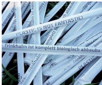
Die kukki Trinkhalm sind biologisch komplett abbaubar.