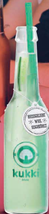
924 KUKKI MULE